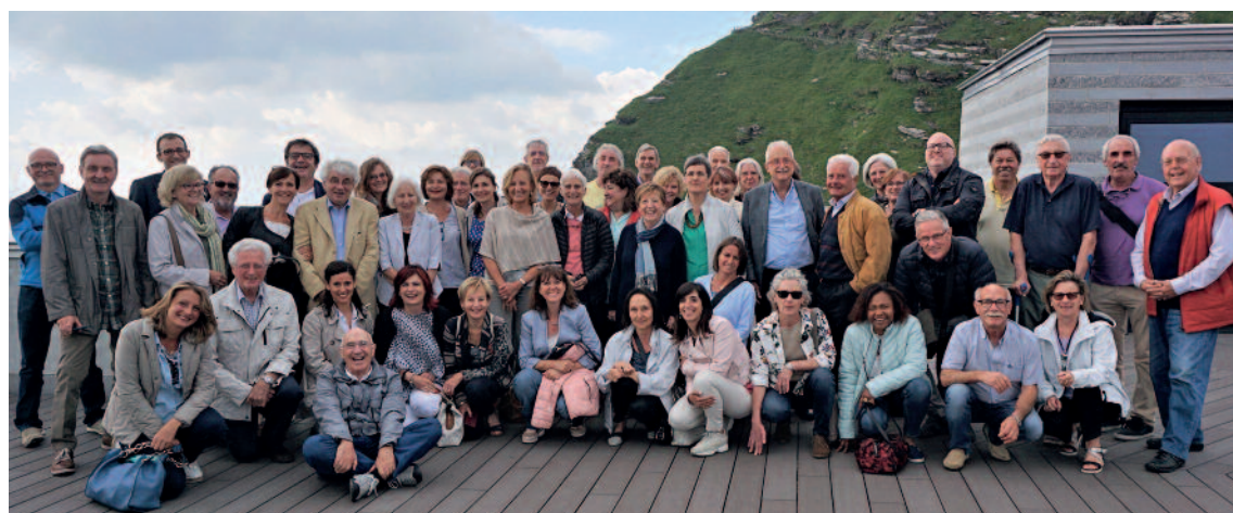
Assemblea annuale al Monte Generoso 7 giugno 2018 con Mario Botta