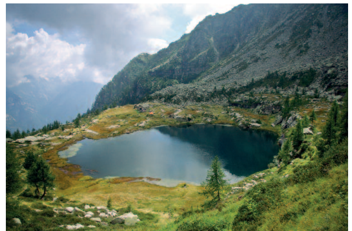
Laghetto Stalaresc, Val Verzasca.

Oggi vorrei solo restare così, cullata dal tepore di questi raggi, non voglio parlare, voglio vivere questi istanti. Ritorno bambina e non penso a domani.