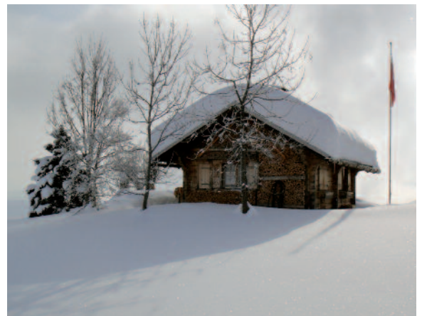
Châlet a Brigels GR.

con un buon bicchiere di Fendant a favore della nostra associazione.