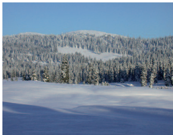
Mont Tendre VD.

E voi, temete che una tale richiesta ufficiale sia faticosa se poi si vorrà tradurre l'affido in adozione? Non fa niente. Fatela lo stesso. Non ci vorrà molto per solidificare in «amore» un «non ancora amore», che ha un estremo bisogno di linfa costruttiva, nel segno della condivisione che affonda le radici in un silenzio profondo; il silenzio di chi sa ancora pregare in silenzio. Anche fuori dal Tempio. Oggi più che mai.