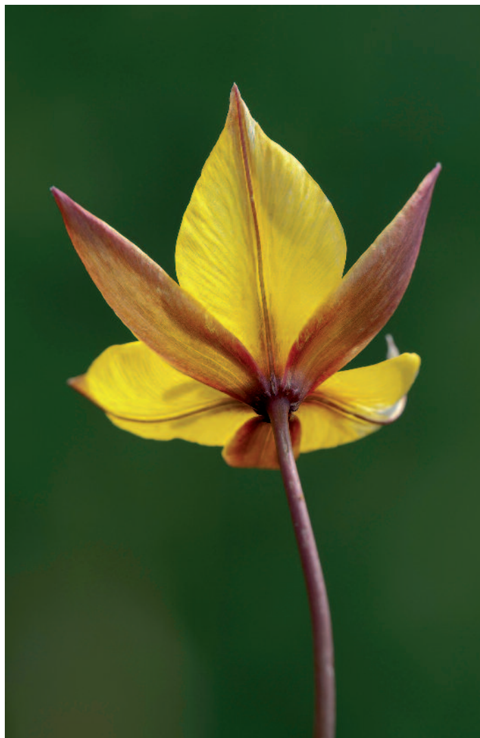
... il tulipano il fiore dell'amore foto di Edmondo Viselli, Rivera.