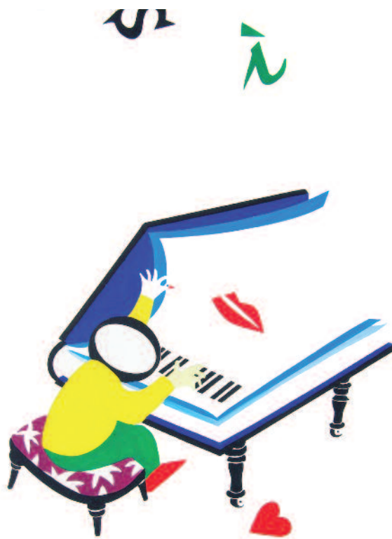
«Quasi una fantasia», acrilico di Fiorenza Casanova.

E, piegando le sdraio, ci raccontiamo questa domenica rivissuta insieme, senza sapere come: a distanza di anni, complice il tempo che aveva confuso i contorni della realtà con quelli della nostalgia, che vorrebbe cancellarli.